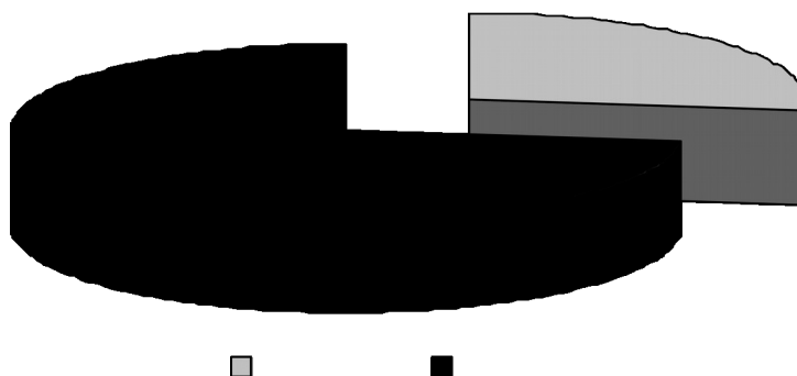
Рисунок 3 – Разбивка общей целевой аудитории по половому признаку

На рисунках ниже представлены данные по анализу целевой аудитории «женщин-автолюбительниц».