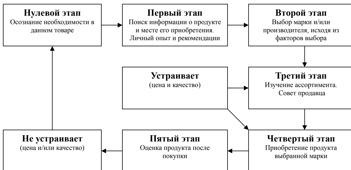
Рисунок 2 - Механизм выбора и покупки СМ

На рынке моторных масел наблюдается достаточно острая конкуренция, в том числе в рекламе. По данным исследовательской компании TNS Gallup Media за 2005–2007 гг. рекламировалось 67 марок моторного масла. И это при том, что количество представленных на рынке марок автомобильных масел не уступает числу автомобильных брендов. Значительное число марок рекламируемых СМ имеет иностранное происхождение. Лидеры по инвестициям за вышеуказанный период: ESSO, Лукойл, Shell, Mobil, Castrol приведены в таблице по годам ниже.